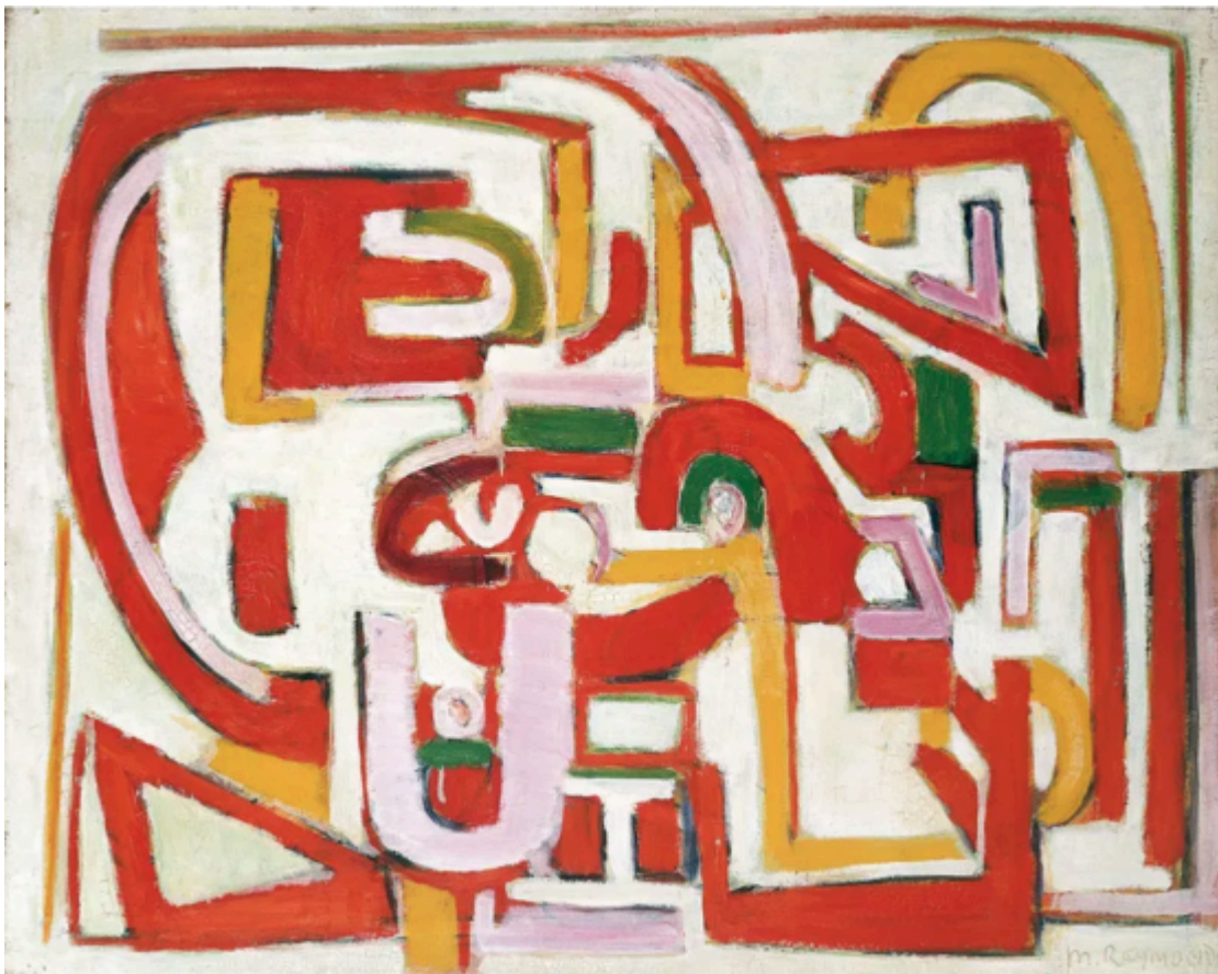
Marie Raymond, Sans titre (Zonder titel), 1948, olieverf op doek, 64,5 x 81 cm, © Marie Raymond Archives, c/o Pictoright Amsterdam, 2026, Particuliere collectie

Nederlandse nationaliteit. Marie Raymond (1908 – 1988) organiseert in de jaren 1950 wekelijkse salonbijeenkomsten voor Parijse kunstenaars, museumdirecteuren, schrijvers en wetenschappers en heeft als kunstcriticus een column in het Nederlandse tijdschrift 'Kroniek van Kunst en Cultuur'. Hiermee is zij tot 1958 in Nederland een ambassadeur van het Parijse artistieke leven. Haar schilderijen bestaan aanvankelijk uit gekaderde kleurvlakken, later in de jaren 1950 worden dat op zichzelf staande kleurvlakken en losse vormen. In 1956 heeft ze een tentoonstelling in Stedelijk Museum Amsterdam, dat ook een werk van haar in de collectie heeft, en in 1957 in de Utrechtse Kring. Maar haar werk bevindt zich voornamelijk in privécollecties.