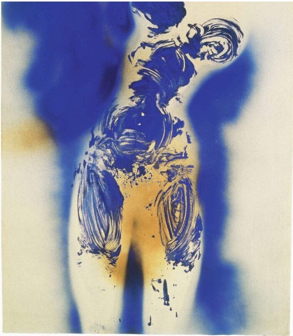
Yves Klein, Zonder titel Antropometrie, (ANT 7), 1960, droog pigment en synthetische hars op papier, 102 x 73 cm, © The Estate of Yves Klein c/o Pictoright Amsterdam, 2026