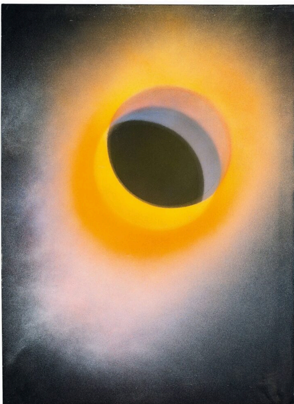
Rotraut, Trou noir (Zwart gat), ca. 1972, acryl op doek gemonteerd op multiplex, 100 x 73,2 cm, © Rotraut c/o Pictoright Amsterdam, 2026

Rotraut, geboren als Rotraut Uecker (1938) maakt tekeningen, schilderijen en sculpturen die hun oorsprong vinden in vormen en verschijnselen in de natuur en de kosmos. In 1958 ontmoet ze Yves Klein met wie ze intensief gaat samenwerken en in 1962, kort voor Yves' dood, trouwt. In 1956 maakt Rotraut haar eerste zogenaamde Galaxies . Door lijm op een houten plaat te druppelen, die te bedekken met zwarte inkt of verf en vervolgens weer te schuren, ontstaan visuele lichtpuntjes als sterren in de kosmos. In 1964 exposeert ze in de Amsterdamse galerie Amstel 47 haar geschilderde Galaxies . In haar serie Vol de sensibilité onderzoekt ze de vormgevoeligheid van schilders als Rubens, Cézanne, Gauguin en anderen. Dit doet ze door dia's van hun schilderijen te projecteren op grote vellen papier, de bewegingen te volgen die ze voelt en de kleuren nadrukkelijk te overschilderen. Rotraut is nog steeds kunstenaar en richtte samen met Daniel Moquay het Yves Klein Archief op en meer recent de Yves Klein Stichting.