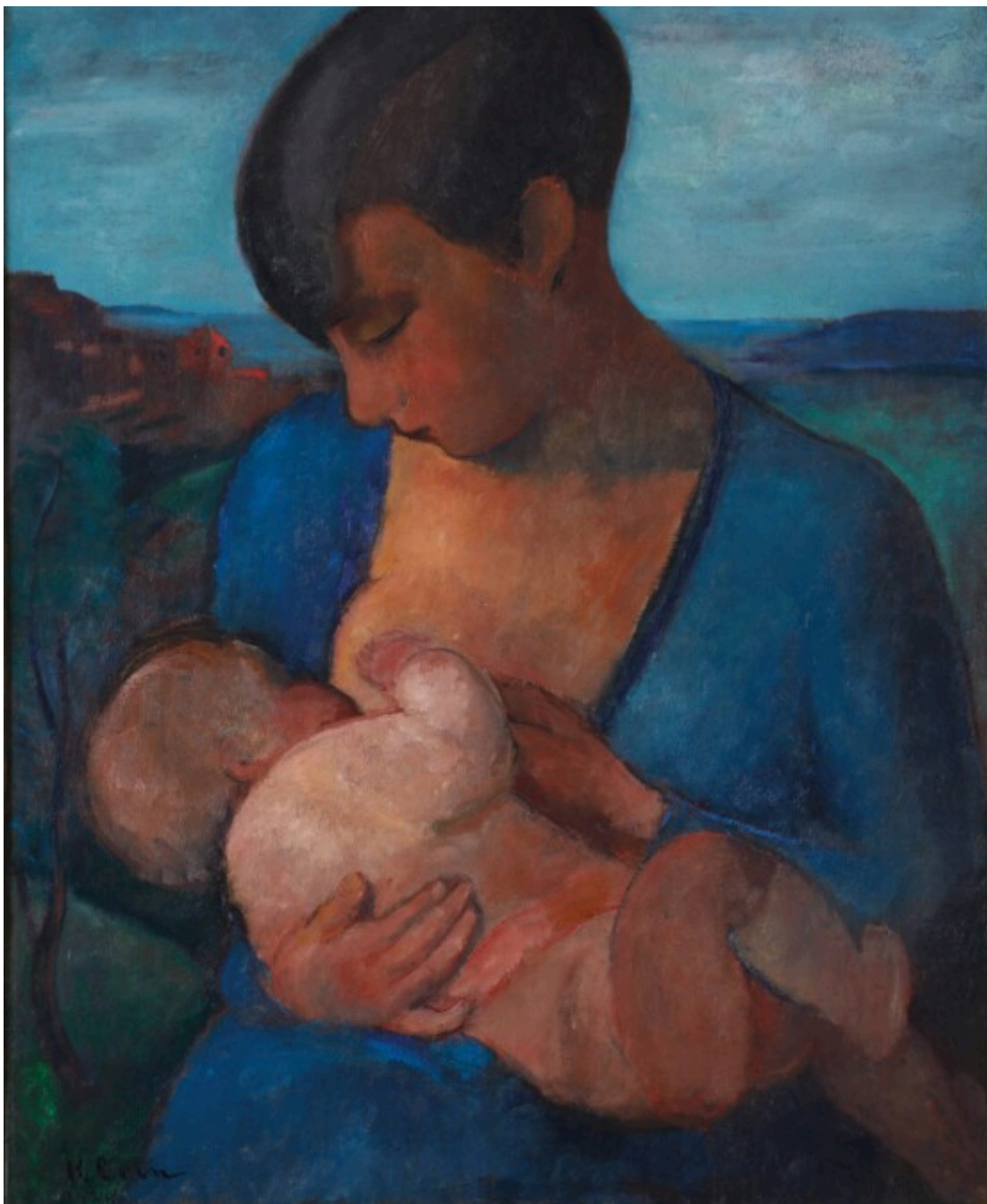
Frits Klein, Maternité (Moederschap) , 1929, olieverf op doek, 73 x 54 cm, © Frits Klein c/o Pictoright Amsterdam, 2026, Particuliere collectie

Vanuit Parijs onderhoudt hij verschillende contacten met Nederlandse kunstenaars en exposeert hij regelmatig in Nederland. In 1965 heeft hij een tentoonstelling in Stedelijk Museum Schiedam, in 1968 in de Rijksakademie voor Beeldende Kunsten in Amsterdam, in 1978 in het Van Gogh Museum in Amsterdam en in 1988 in Pulchri in Den Haag.